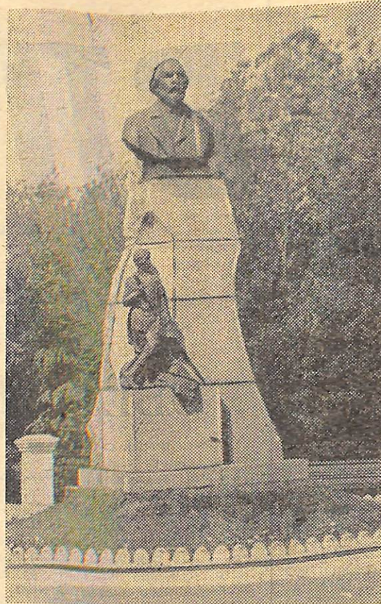
Памятник Илье Николаевичу Ульянову.

Но молнии могут служить и другой цели — моральному поощрению. Это у нас пока редко