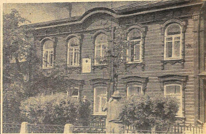
Дом, где В. И. Ленин провел раннее детство. Во флигеле этого дома родился В. И. Ленин.